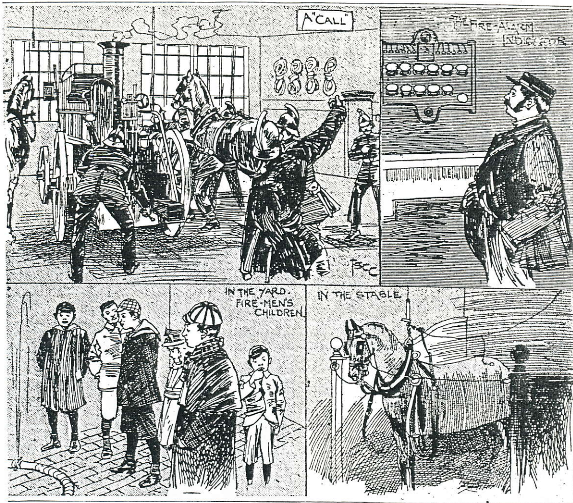
En brannstasjon for 100 år siden. Fra Hansens utklippsbok.