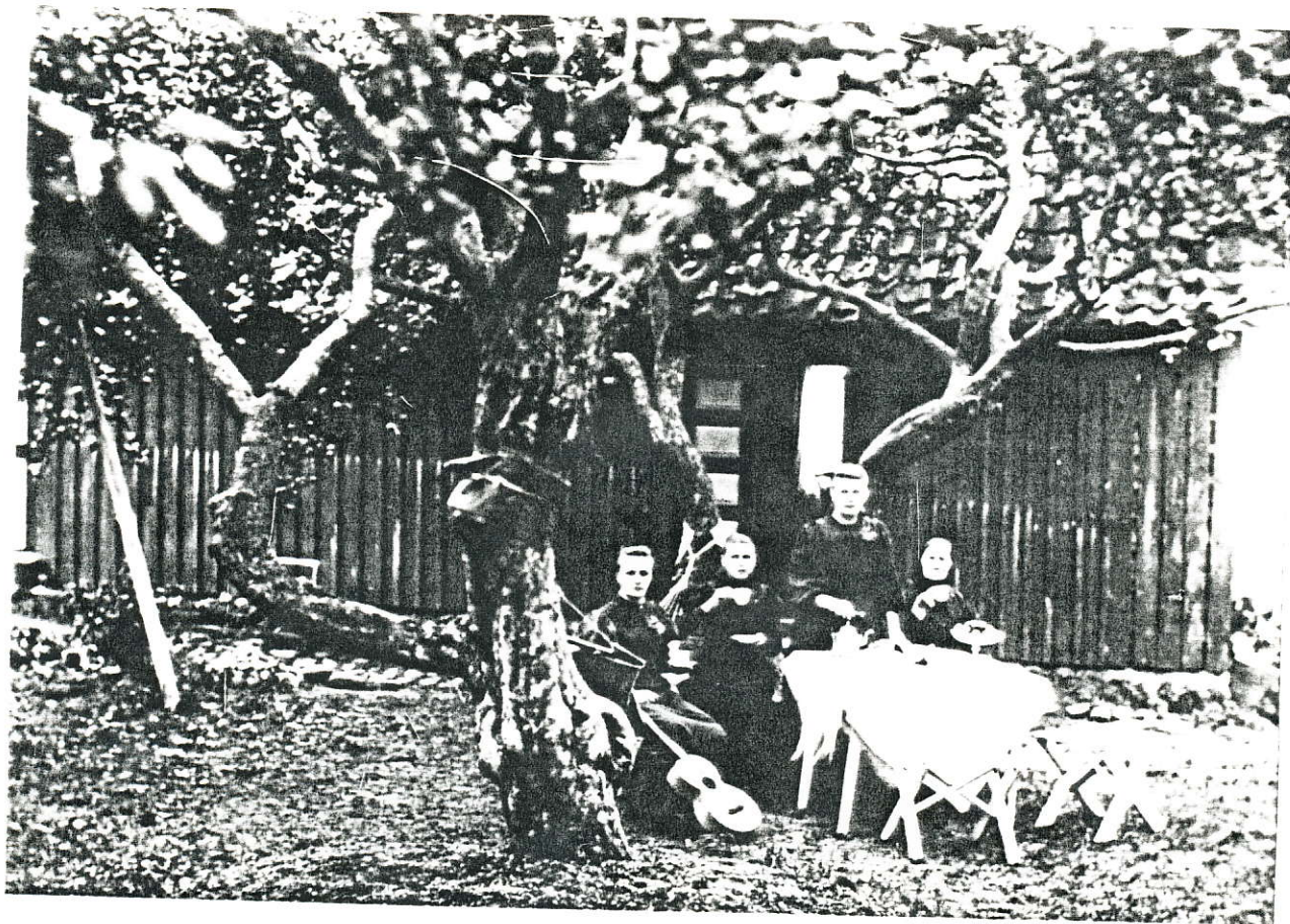
Kaffestund i hagen.