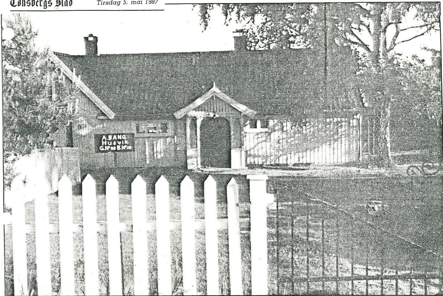
Slike veimerker sto det ved veikanten.