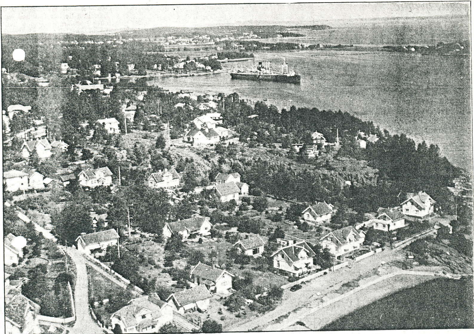
Stranden er ryddet og det er kommet en del hus på Juelsåsen. Og på dette bildet fra 1956 ser vi Pelagos i opplag i Bogen.